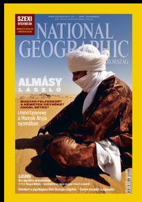
Korábbi számok További különszámok